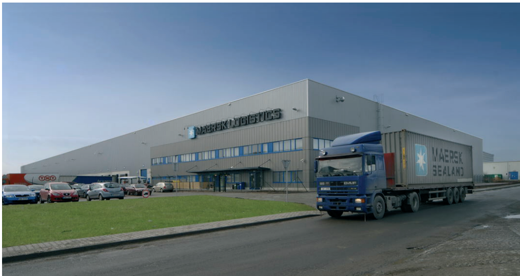
■ Skladovací prostory v Pardubicích

Na českém trhu působí Maersk Logistics od roku 1995. V roce 2002 byl otevřen hlavní logistický terminál v Praze – Hostivici. V současné době mohou zákazníci využít kromě tohoto také další terminály v Mělníku, Jaroměři a v Olomouci.