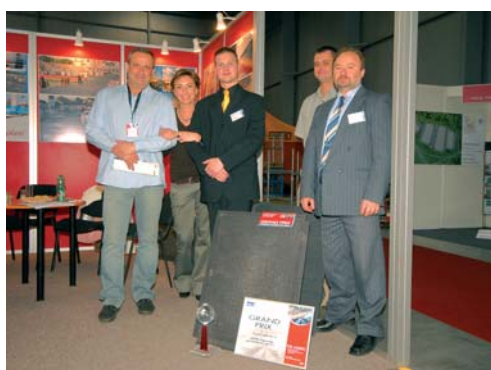
Účast na veletrhu FOR LOGISTIC

je vysoká zátěž z provozu motorových vozíků. Druhou oblastí je segment dopravního značení, kam spadá výroba zpomalovacích a vodících prahů, obrubníků a podstavců pro dopravní značení.