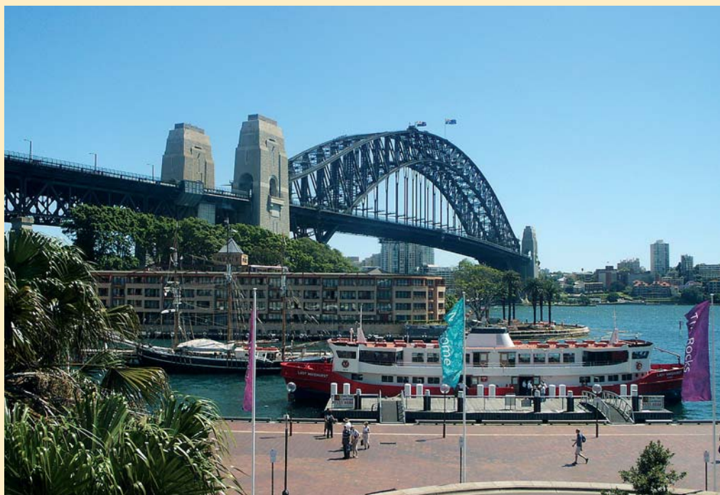
Most nad přístavem

Budování této impozantní dominanty se však neobešlo bez problémů a kompromisů, které však místní průvodci takticky přecházejí, nebo zlehčují. V roce 1955 byl vypsán konkurz na stavbu této budovy. Vyhrál ho návrh do té doby ne příliš známého dánského architekta Jorn Utzona, který byl neoriginálnější, ale poměrně drahý. Stavební práce byly zahájeny v roce 1959, ale od začátku se ukázalo, že původní rozpočet na 7 milionů australských dolarů je značně podhodnocen. V roce 1965 došlo k výměně vlády, která projevovala výraznou nespokojenost s obrovskými náklady, o kterých bylo jasné, že i nadále neodhadnutelně porostou. Utzon, který odmítal výhrady vlády akceptovat a nedohodil se s ní o dalším postupu, v roce 1966 v pokročilém stádiu hrubé stavby na její dokončení rezignoval.