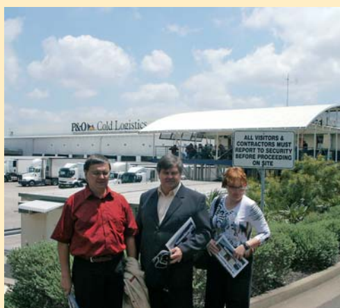
Na návštěvě v P&O Cold Logistics

Do Sydney přilétáme brzy ráno a všichni se těšíme do hotelu na sprchu a chvíli odpočinku. Na letišti nás překvapila důsledná kontrola zavazadel. Celníci primárně nehledali kontraband, ale velmi důsledně prověřovali, zda nevezeme zejména žádné výrobky ze dřeva, které by mohlo do země zavléci nějakou dřevní nákazu. Prověřují i podpatky u dámských lodiček, ale našťastí naše dámy měly