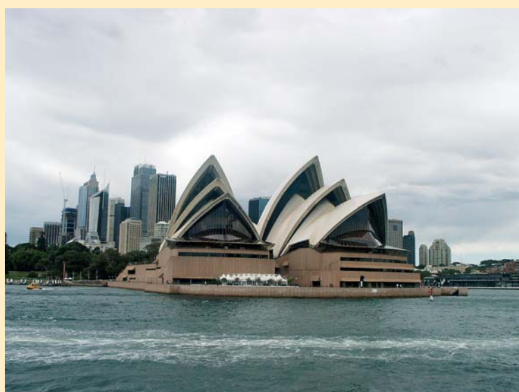
Sydney s Operou v popředí