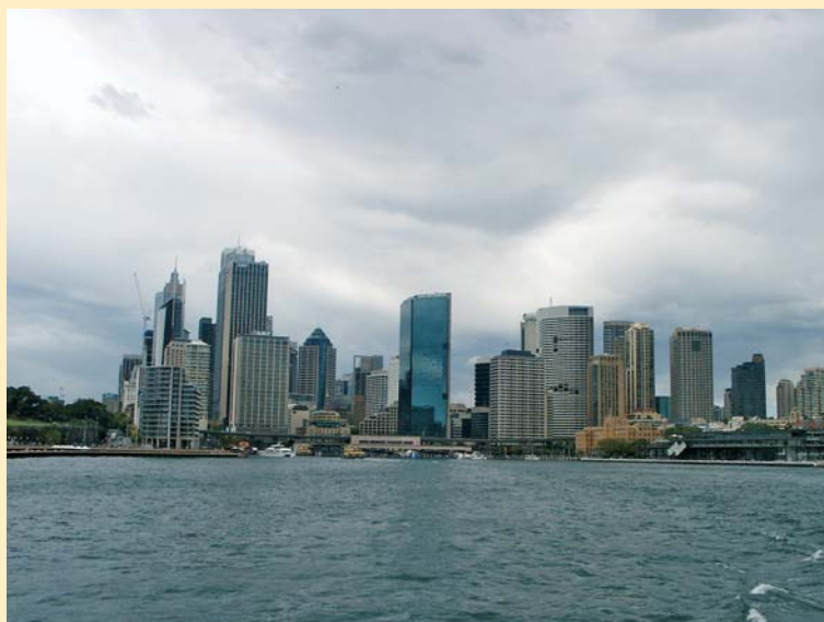
Pohled na centrum Sydney z moře