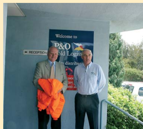
Prezidenti IARW a ČLA

Budova Opery v Sydney se během let stala architektonickým symbolem Austrálie a Australané jsou na ni patřičně pyšní. Je to hlavně díky netradičnímu řešení, které bylo zvoleno. Budova má tvar lastur, a je postavena na výběžku do moře. Díky tomu a skutečnosti, že záliv je ohraničen kopci, je na ni výhled zdaleka, prakticky ze všech