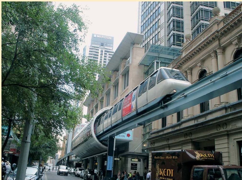
Monorail pro veřejnou dopravu v centru Sydney

flaci by tato suma byla dnes minimálně dvojnásobná). Při vzniku projektu se pochopitelně nikdo nezabýval nezbytnými náklady na údržbu, které jsou také obrovské. Tak např. spoje betonových žebor vykázaly životnost. V roce 1989 byl učiněn odhad nákladů na nezbytnou opravu ve výši 86 milionů australských dolarů. Jedná se o nesmírně nákladnou záležitost, která bude trvale vyžadovat