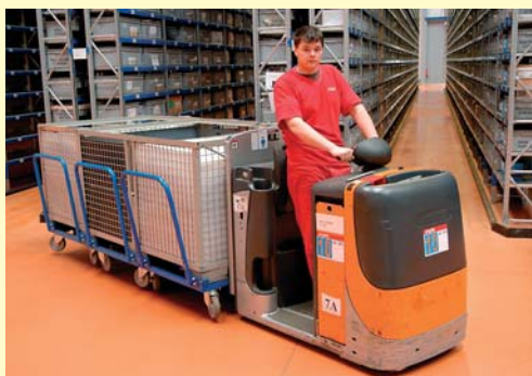
Mravenci mezi regály

lékařských přípravků v České republice. K nim potom přibyli další zákazníci z jiných oblastí - pro představu uvedme lepidla a minerální oleje."