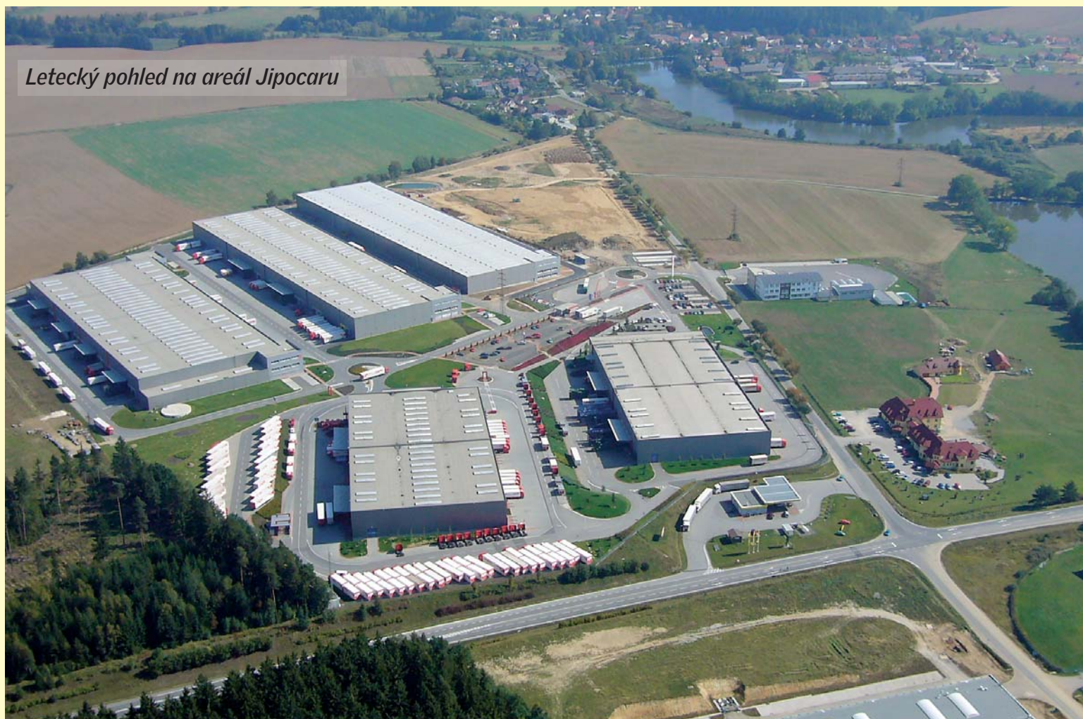
Letecký pohled na areál Jipocarů