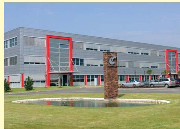
Ohled na životní prostředí je i takto patrný

Satelitní systém sledování vozidel, který využívá řada firem, zefektivnil provozování vozového parku dopravních firem. Řidiči si již nemůže zvolit svoji trasu. Velice často bylo možné po cestě „navštívit“ svoji oblíbenou čerpací stanicí, nebo obchod, který chtěl řidič při své cestě využít. Dnes satelitní systém na tyto odchylky upozorňuje dispečink a řidič je tak pod neustálou kontrolou. Druhý a mnohem větší přínos pro firmu je kontrola průběhu přepravy. Dříve