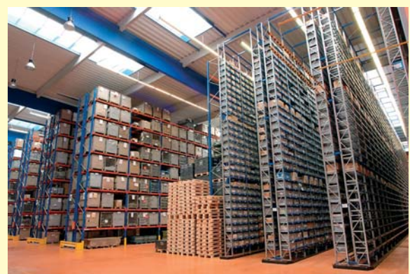
V desetitisících palet „chaoticky“ ukládaných se vyzná jen počítač

kteří byly pro svůj účel zkolaudovány před třiceti či více lety. Tyto prostory přestávají postupně vyhovovat a seriózní firmy v tomto oboru si nemohou dovolit jakkoliv pochybit a porušovat stále a stále složitější legislativu týkající se zejména životního prostředí. Zpočátku jsme si nemysleli, že bude tak obtížné vybudovat a vyřídit povolení k ukládání těchto látek. Brzy jsme ale vstoupili do bludného administrativního kruhu a dalo nám to moc a moc práce se z něj dostat. Dokončení schvalovacího procesu s dodržáním naplánovaného termínu byl nervák, ale všechno jsme zvládli. Díky tomu se nám pak podařilo i získat většinu distributorů rostlino-