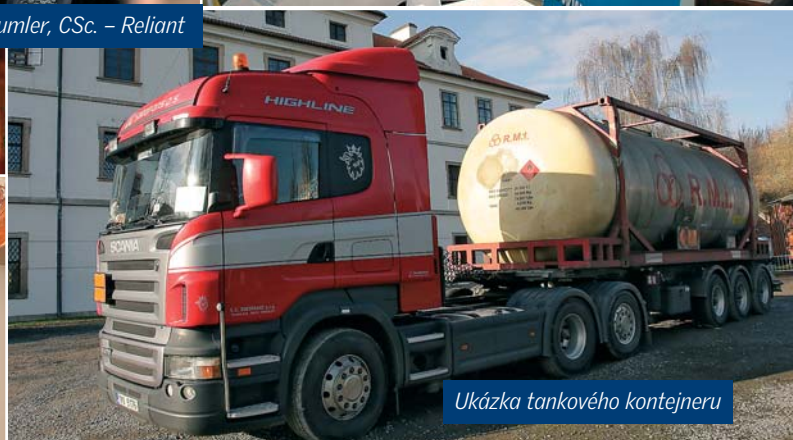
Ukázka tankového kontejneru