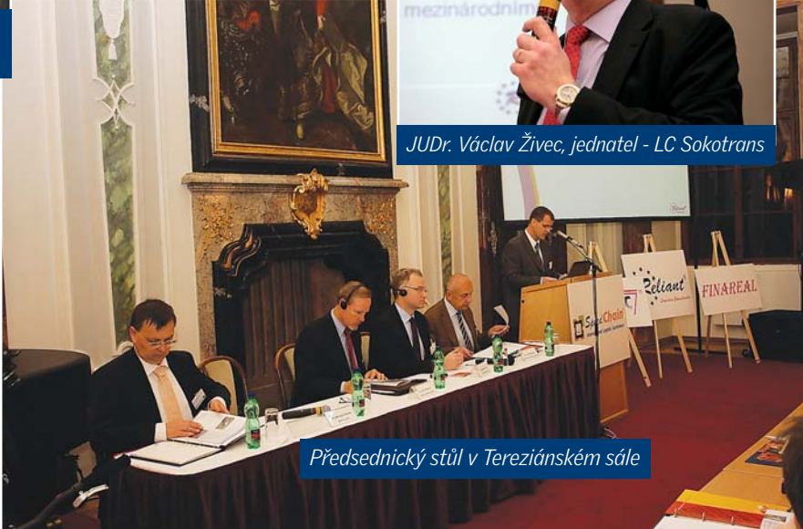
Předsednický stůl v Tereziánském sále