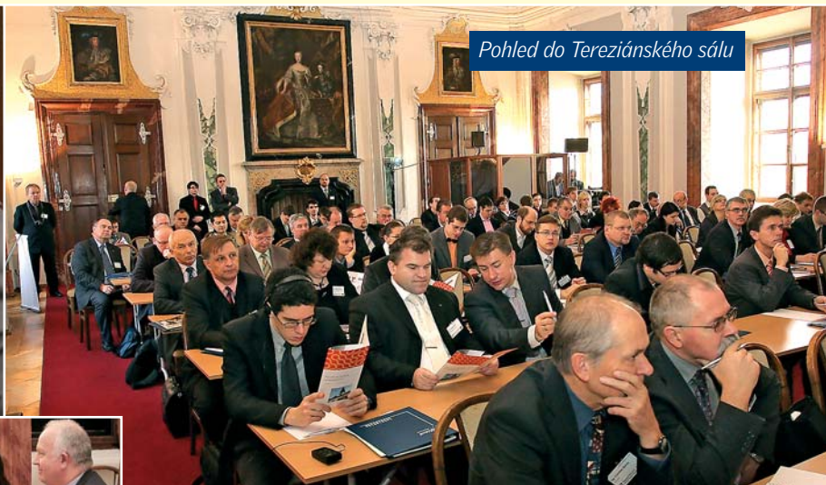
Pohled do Tereziánského sálu