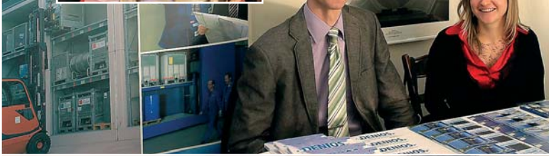
Ing. Vít Sedmidubský, Ministerstvo dopravy ČR