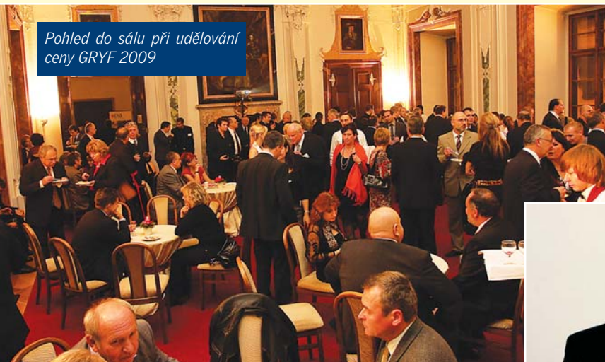
Pohled do sálu při udělování ceny GRYF 2009