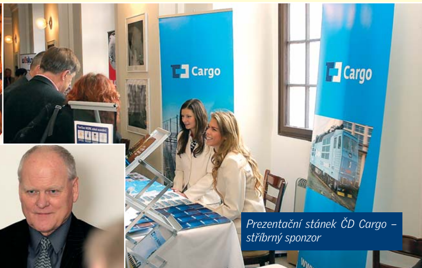
Prezentační stánek ČD Cargo – stříbrný sponzor