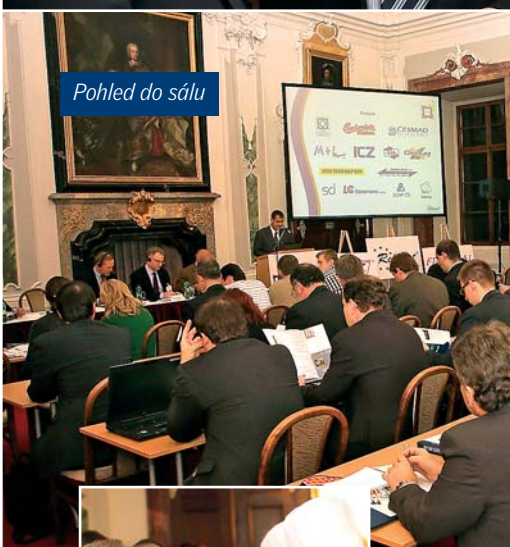
Pohled do sálu