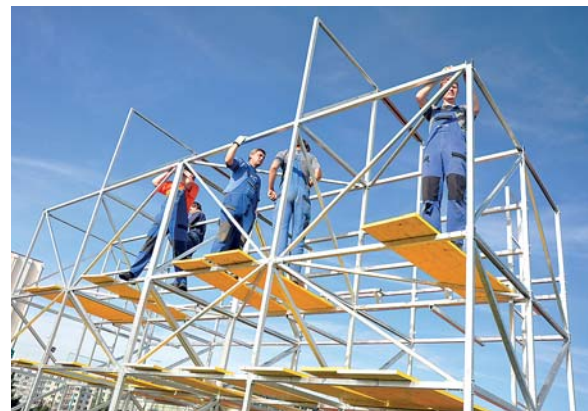
Stavění věží při mistrovství ČR v požár. sportu (Třebíč 2009)

stovky druhů materiálů – lopaty, kolečka, kýble, hadry na podlahu, tisíce litrů dezinfekčních prostředků, náhradní oblečení zhruba pro pět tisíc lidí. V případě nouzové situace v jednom regionu – tentokrát na Moravě – je vytvořen distribuční meziklad, jenž soustředí zásoby dovážené ze vzdálenějších skladů a odkud je pomoc rozvážena dle aktuálních potřeb. Při povodních v roce 2002 to fungovalo obráceně – moravské sklady přivážely pomoc do Čech.