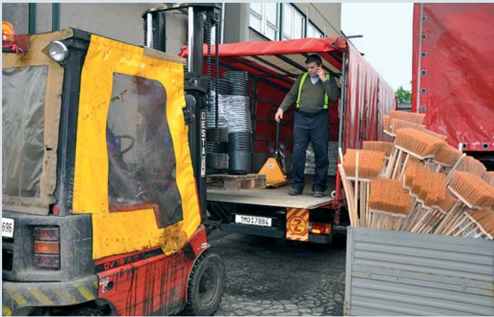
Transport of materials during flood in Karviná (2010)

The Base of Logistics – originally a military facility – was transferred to the competency of the Fire Rescue Service on 1 January 2001 and it has four basic scopes of activities. The first task is to look after civil protection means, the second to purchase assets for fire brigades centrally. The third important task is responsibility for supplies of means and materials used by the fire rescue service in case of emergencies: floods, big fires, evacuation of inhabitants, etc. The last sphere of activity is logistic support to fire brigades in other areas such as lending of equipment to foreign countries or support to fire brigade exercises, including transport