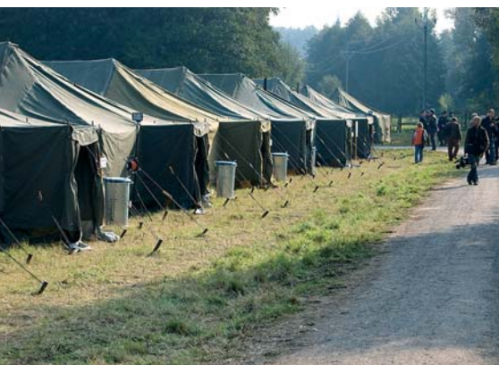
Výstavba a provoz materiální základny humanitární pomoci v obci Čechy pod Kosířem (2007)

ochrany, druhým centrální pořízování majetku pro hasičské záchranné sbory. Třetí důležitou úlohou je zodpovědnost za tzv. normativy prostředků a věcných materiálů, které využívá hasičský sbor při vyhlášení pohotovosti nebo krizových stavů právě při povodních, velkých požárech, evakuaci obyvatelstva a jiných situacích. Poslední oblastí činnosti je logistická podpora hasičských sborů při ostatních akcích – zapůjčování prostředků do zahraničí, stavba stanů, věží, tribun, podpora cvičení profesionálních i dobrovolných hasičů. To zahrnuje i spolupráci na přepravě materiálů v rámci hasičského záchranného sboru nebo poskytování humanitární pomoci.