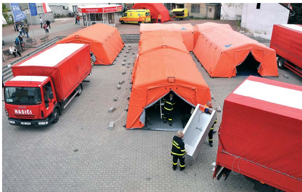
Ukázka výstavby materiální základny humanitární pomoci (Lysá nad Labem 2009)

Pomoc je poskytována a koordinována prostřednictvím krizových štábů, které soustřeďují požadavky z jednotlivých obcí a jsou napojeny na krizové štáby jednotlivých krajů. Konkrétní požadavky jsou na základně logistiky vyhodnoceny, rozhoduje se, co, kdy a v jakém množství může být poskytnuto. Cílem celé „mašinérie“ je co nejrychleji dostat materiál tam, kde je nejvíce potřeba. Jak velký rozsah pomoci můžeme od základny logistiky očekávat? Základna má například k dispozici 3 000 vlastních vysoušečů, ale zároveň sleduje i pohotovostní zásoby státních hmotných rezerv a díky tomu může využít i přibližně další tisícovku těchto zařízení. V pohotovosti má