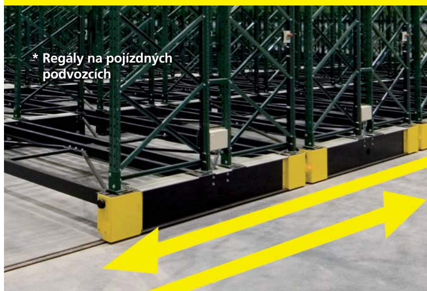
* Regály na pojízdných podvozcích