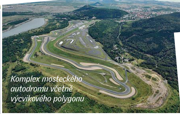
Komplex mosteckého autodromu včetně výcvikového polygonu