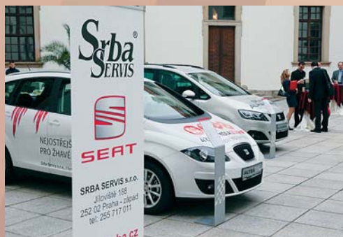
Prezentace osobních a užitkových vozů v atriu.

Člen Poslanecké sněmovny Parlamentu ČR vedoucí Katedry technologie a řízení dopravy, dopravní fakulta Jana Pernera, Univerzita Pardubice